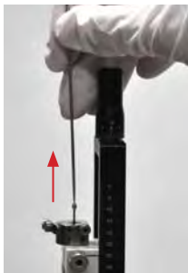
2. Rimuovere l'introduttore della pista selezionata.