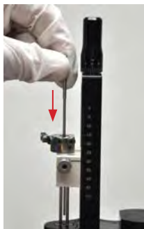
3. Inserire l'introduttore per elettrodi nella pista selezionata fino al completo insediamento. Tenere premuta l'impugnatura del mandrino per assicurare che il mandrino fuoriesca dalla parte inferiore dell'introduttore.