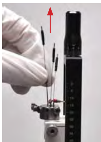
1. Rimuovere tutti i microelettrodi.

Dopo che la registrazione del microelettrodo è stata eseguita e le aree anatomiche sono state confermate: